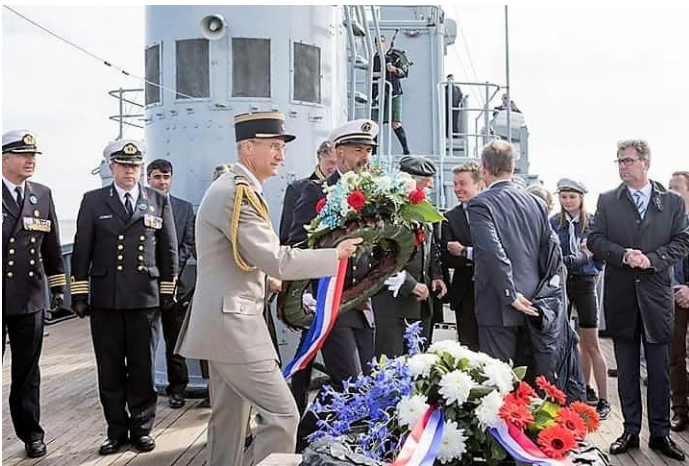
De kransen worden in zee geworpen.