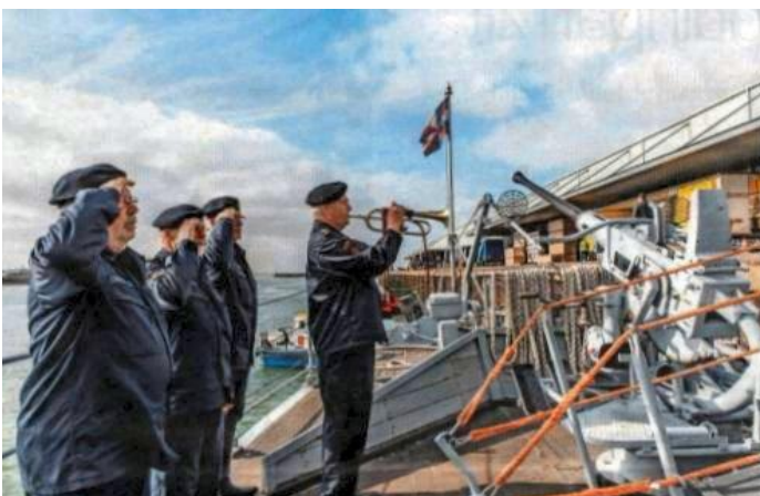
De taptoe schalt, de stilte valt.