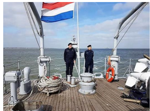
Na de plechtigheid de vlag in top!