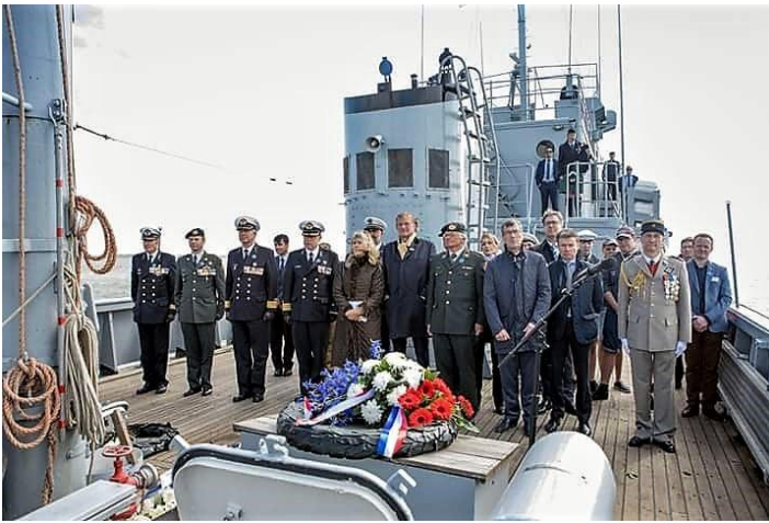
Eén minuut stilte wordt in acht genomen.