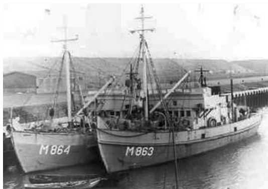
Hr. Ms. Putten M864 en de Hr. Ms. Marken M863 in 1943.