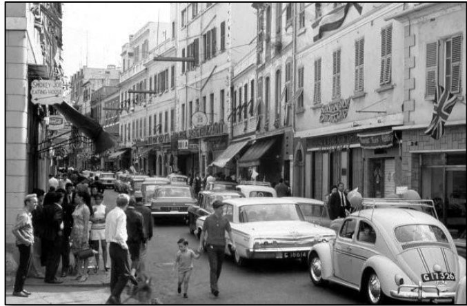
Op de hoek van Lynch's Lane.