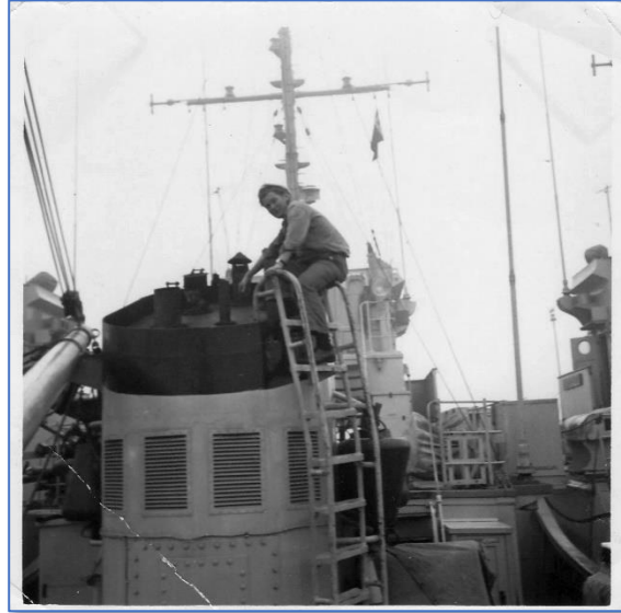
Moeten nog open!