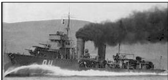
Hr.Ms. Piet Hein op volle snelheid.