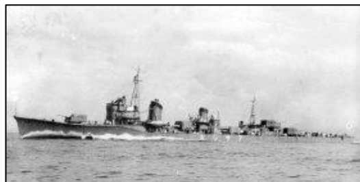
Asashio in actie.